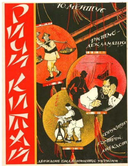
Рис. 5. Титулка ритмодекламації Ю. Мейтуса «Річі Китай»

Вїдомо, що Мейтус неодноразово звертався до жанру ритмодекламації, зокрема, на слова В. Блакитного, М. Йогансена, однак точна інформація про їх кількість відсутня (рис. 5).