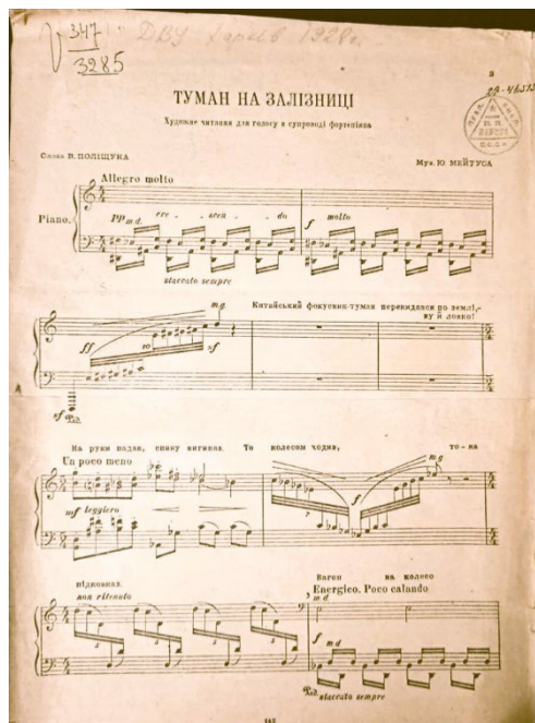
Рис. 4. Перший аркуш мелодекламації Ю. Мейтуса на слова В. Поліщука «Туман на залізниці»

Головний образ мелодекламації Туман на залізниці – залізничний потяг, нестримний рух вперед, сила енергії, швидкості, шаленої, гнівної (рис. 4).