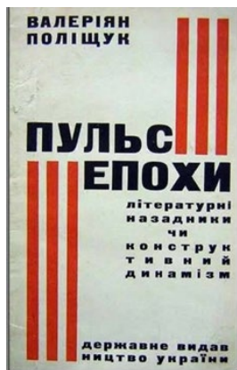
Рис. 2. В. Єрмілов. Обкладинка книги Валер'яна Поліщука «Пулс епохи». 1927, Харків