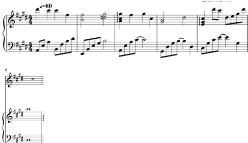
Приклад 1. Чжао Цзіпін. «Думки тихої ночі», Вступ. 1–6-т.т.

Фактурне насичення затриманнями та мелодичними формулами, спорідненими з п'ятизвукowymi ладами (гун 宫, шан 商, цзюе 角, чжи 徵, юй 羽), формує звуковий простір медитативної статичності. У поєднанні з імпресіоністичною колористикою ці ладові елементи створюють атмосферу стриманої туги, світлого смутку й внутрішньої невирішеності, що сприймається як відкрите емоційно-смісловіе питання (Приклад 1).