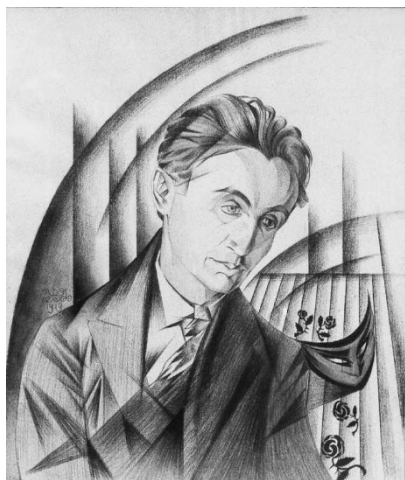
Рис. 3. М. Жук. Портрет Леся Курбаса, 1919 рік