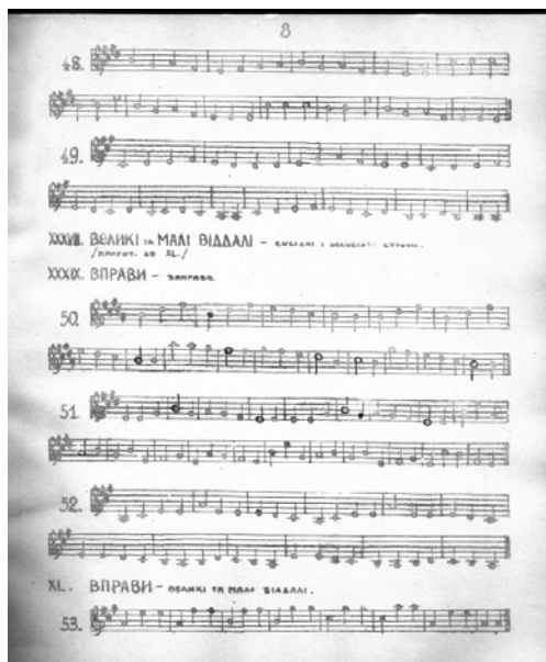
Рис. 5. Сторінка «Методичного підручника науки гри на скрипці» С. Огородніка