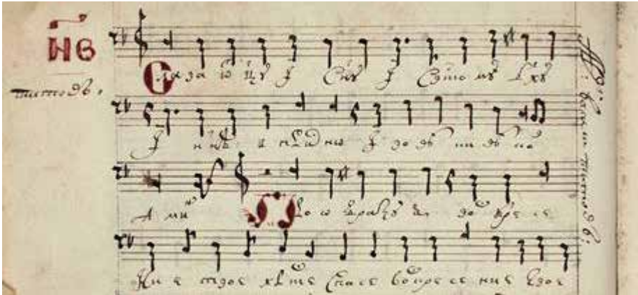
Рис. 4. Авторизована партія концерту В. Титова ГНТБ СО РАН, Тих. 503, арк. 124 зв.

творів, у тому числі авторських. На підставі авторизованих матеріалів новосибірського рукопису, у львівській пам'ятці вдалося атрибутувати партії 15 чотириголосих концертів М. Дилецького, двох служб та восьми концертів В. Титова, двох концертів І. Календи і двох концертів А. Цибульського (рис. 5).