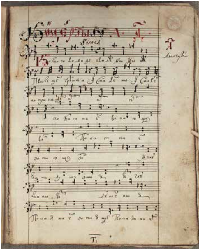
Рис. 3. Авторизована партія концерту М. Дилецького ГНТБ СО РАН, Тих. 503, арк. 60

Порівняння змісту львівського і новосибірського рукописів, які є голосовими книгами різних чотириголосих комплектів, показало, що в них співпадає велика кількість