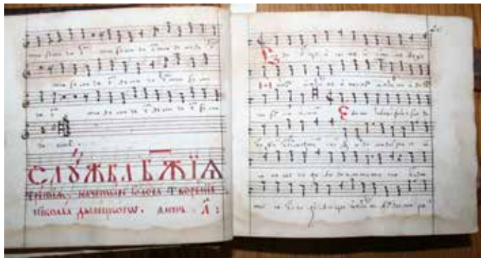
Рис. 1. Авторизована партія служби М. Дилецького НМЛ, Ркк. 1209, арк. 19 зв. – 20

Як і львівський рукопис, ця пам'ятка є однією голосовою книгою комплексу чотириголосих партесних творів, місце перебування трьох інших книг є невідомим. Унікальність цього рукопису полягає у наявності численних авторських указівок на полях аркушів, поруч із партіями творів, а також у реєстрі; усього таких указівок 59. Трапляються прізвища Миколи Дилецького, Василя Титова, Іоана Календи (рис. 2), Арсенія Цибульського, Василя Гусєва, Фат'янова.