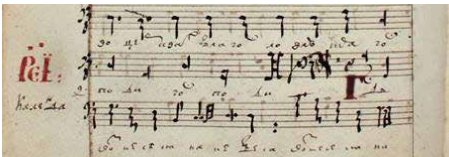
Рис. 2. Авторизована партія концерту І. Календи ГНТБ СО РАН, Тих. 503, арк. 100 зв.