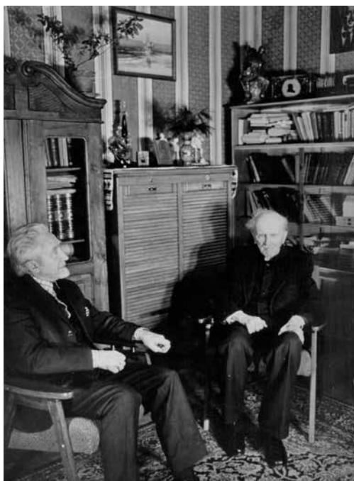
Фото 6. Микола Колесса у гостях у Станіслава Людкевича у помешканні на вулиці Військовій (нині – Людкевича), фото зроблене у робочому кабінеті С. Людкевича. 1978 р.

24 січня 1979 р. у львівській філармонії відбулися урочистості з нагоди 100-ліття С. Людкевича, в рамках яких симфонічний оркестр і хорова капела «Трембіта» під керівництвом М. Колесси виконали повністю «Кавказ». Диригент згодом згадував про це виконання: «Думаю, що найкраще вдалося виконати «Кавказ» 24 січня 1979 року, коли святкували сторіччя Станіслава Пилиповича [...]. Це був історичний вечір, і, здається, я ніколи не відчував такої високої відповідальності за виконання цього прекрасного і величного твору. І, знаєте, може, це почуття, яке я назвав би не земним, а небесним, допомогло мені відкрити для себе велику тайну: тільки цього вечора я зміг збагнути і опанувати цей твір так, як ніколи досі» 67 (фото 7).