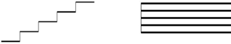
Іл. 1. Дві схеми «драбинки» із «Початкового курсу навчання дітей нотного співу» К. Стеценка

не лише у загальноосвітніх, але й музичних школах. Переважна більшість його праць датуються 1918–1920 рр. По при те, що за життя митця майже жодна з його музично-педагогічних праць так і не була надрукована, вони засвідчують не лише надзвичайно багатий викладацький досвід М. Леонтовича, нерозривний зв'язок його музично-педагогічних принципів та композиторської творчості, але й знання найновіших у той час музично-педагогічних тенденцій (наприклад, системи евритмії Е. Жака-Далькроза 20 ).