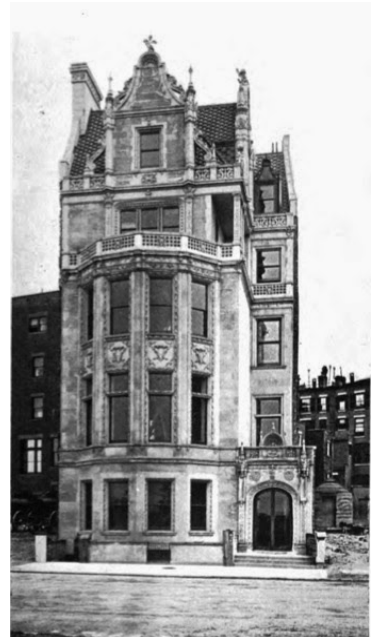
Будинок на Ріверсайд-драйв, 75. Нью-Йорк. Архітектор Касс Гілберт.