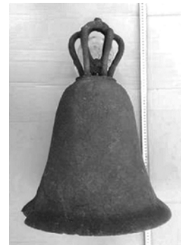
Дзвін XII–XIII ст., проданий 2015 року на аукціоні

В XI–XII ст. на Русі формується дзвонарська лексика: «било» 51 , «благовѣствование», «благовѣстник» 52 , «коло-