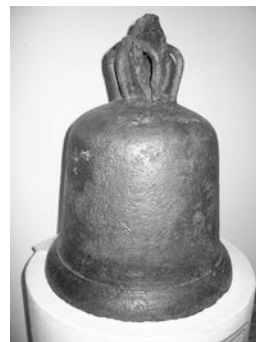
Дзвін XI–XII ст. із Німеччини, знайдений на вул. Хорива, Київ

Дзвін приземленої форми, язик відсутній. На висоті 27 см від основи розміщувався по всій окружності у вигляді вузької стрічки латинський напис заввишки 2,8 см: GODEFRIDUS. ISTUT. VAS. TITULAVIT («Годфрідом ця посуда названа»). З урахуванням цього вважають, що дзвін відлили в Німеччині, яка в XI–XIII ст. була найбільшим виробником дзвонів. Вуликоподібна форма дозволяє його датувати XI–XII ст. 23