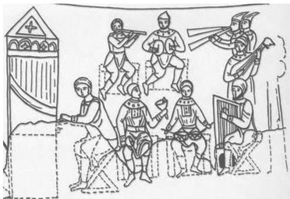
Фрагмент фрески. Софія Київська

В соборі св. Софії в Києві на фресці XI ст. зображені ручні дзвінки серед музиканті інструментального ансамблю з оточення константинопольського імператора (див. мал.). Серед артистів, зафіксованих візантійськими майстрами на стіні південної вежі храму, стоїть музика з ручними дзвонами. Мабуть, вони були поширені в інтернаціональних гуртах, які час від часу навідували столичний Константинополь 35 .