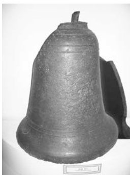
Дзвін XII–XIII ст.

Численні археологічні пам'ятки й літописні згадки про дзвони і дзвонарське мистецтво дозволяють зробити припущення про їхнє певне поширення на теренах Київської Русі. Підтвердженням цього може бути «Слово про Ігорів похід», де барвисто описано використання дзвонів під час богослужень у храмах Русі-України, мовиться про звучні дзвони Полоцька, якими били Всеславу у святій Софії («Позвониша Заутренню рано в колоколы»). Автор «Слова», як добрий знавець минушини, або прямо вказує на дзвоніння, або це метафора, та в кожному разі він хотів показати, що дзвін, дзвоніння в той далекий час сприймали як обрядове, урочисте, прославляюче дійство: «Комони ржуть за Сулою – звенить слава вь Києвѣ» 36 («Коні іржуть за Сулою – дзвенить слава в Києві» 37 ).