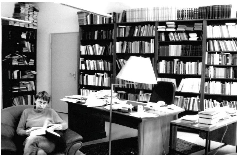
Бібліотека інституту славістики, Вюрцбург