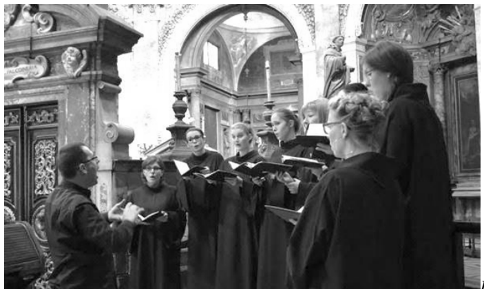
Ансамбль Mulierum Schola Gregoriana Clamaverunt Iusti .