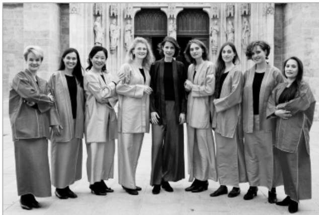
Ансамбль Resupina ( http://www.resupina.at/gfx/group.png )

на пенсію, вчений знову повертається у бенедиктинський монастир. Монахи-бенедиктинці продовжують багаторічну традицію та виконують григоріанські мелодії. У колекції солемського монастиря численні CD-диски із записами латинської монодії.