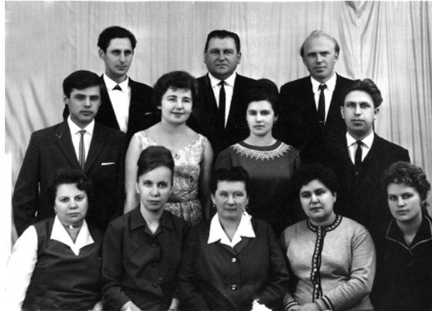
Перші викладачі школи