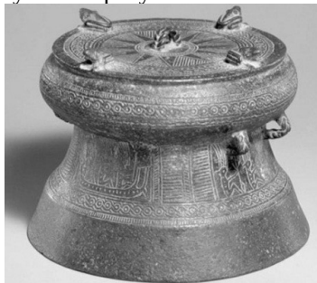
Рис. 3. Ритуальний барабан для викликання дощу (Південний Китай)

Приблизно від III ст. до н.е. на «барабанах» з'являються відлиті з бронзи фігурки жаб (рис. 3). Вони симетрично розташовані по краю диска. Кількість жаб на «барабанах» завжди є парною. Найчастіше трапляються чотири, рідше – шість, вісім та дванадцять земноводних. На думку Хун Шена, дослідника бронзових барабанів, знайдених у Південному Китаї, їх використовували в ритуалах викликання дощу. Він посилається на свідчення філософа Хань Фейя (III ст. до н. е.), вміщене у роботі «Хань Фей-цзи» [14, 70-71]. Тун Еньчжен у статті, присвяченій культовій ролі юньнаньських бронзових барабанів зазначав, що вони були символами влади та військових перемог [12, с. 9]. Вчений також уважає, що барабани мали й інше, значно глибше значення. Корпуси інструментів прикрашені космогонічною символікою, зокрема, дванадцятипроменевою зіркою, вписаною в коло. Це символ Неба, відомий з розписів на кераміці доби неоліту. Таким чином,