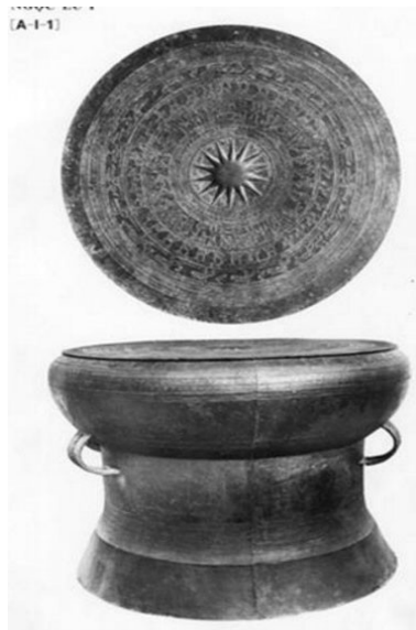
Рис.1. Бронзовий барабан тунгу.

Барабани тунгу (з китайської – «бронзовий барабан») є своєрідною візитною карткою південного регіону Китаю (рис.1). Зазначимо, що вони лише наслідують форму барабана. За міжнародною систематикою музичних інструментів Горнбостеля–Закса барабани належать до мембранофонів, тобто складаються з глиняного, дерев'яного або металевого корпусу (різних форм і розмірів) та шкіряної мембрани, натягненої на один чи обидва отвори [4, 244-246]. Бронзові «барабани», які повністю відливалися з металу, належать до класу ідіофонів і входять до підгрупи гонгів (класифікаційний код 111.241.1) [4, с. 240]. Однак у сучасному інструментознавстві на означення цього різновиду ідіофонів і надалі використовують традиційний термін «бронзові барабани».